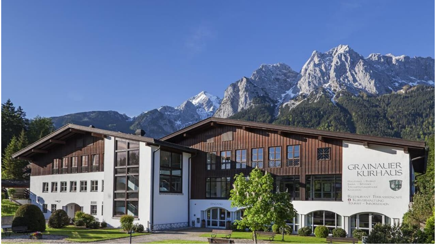
Touristinformation Grainau