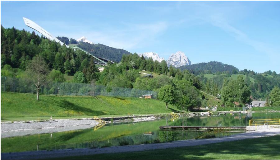
Ausblick auf Schanze