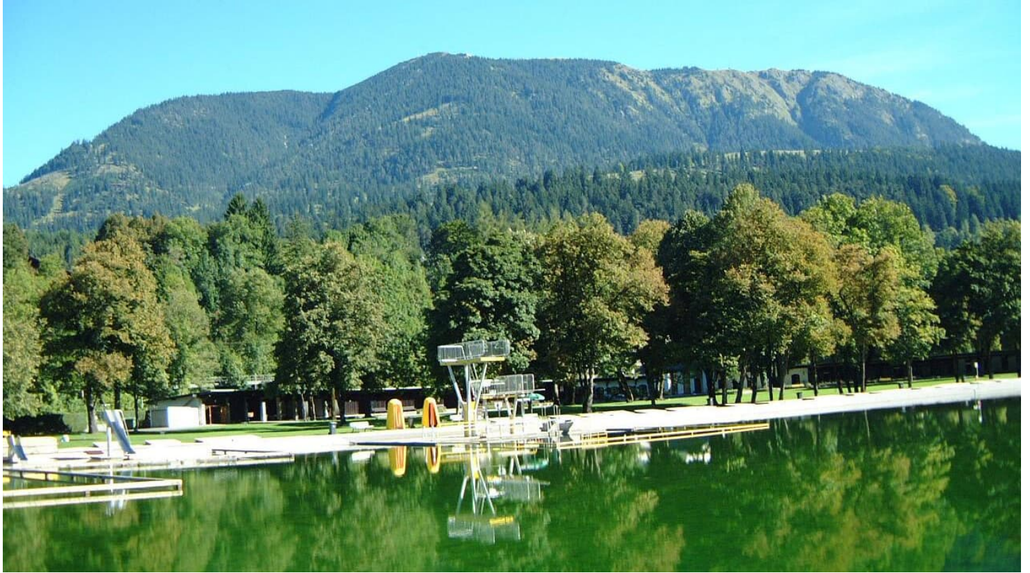
Aussicht auf Wank