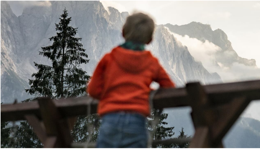
Blick auf die Zugspitze