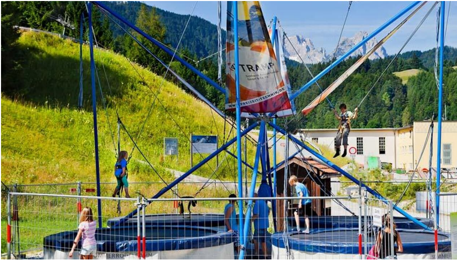
Bungee Trampolin