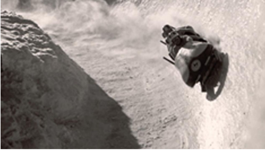
Olympia Bobbahn