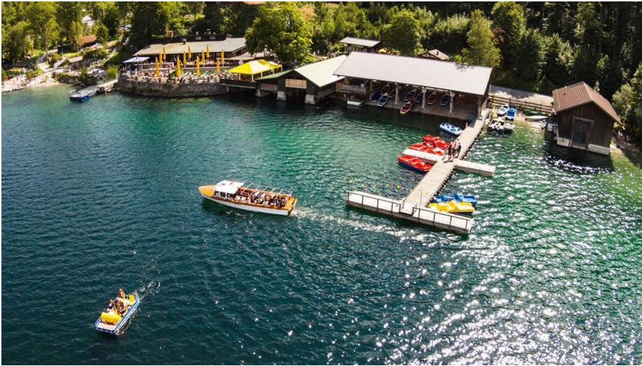
Bootsverleih am Eibsee