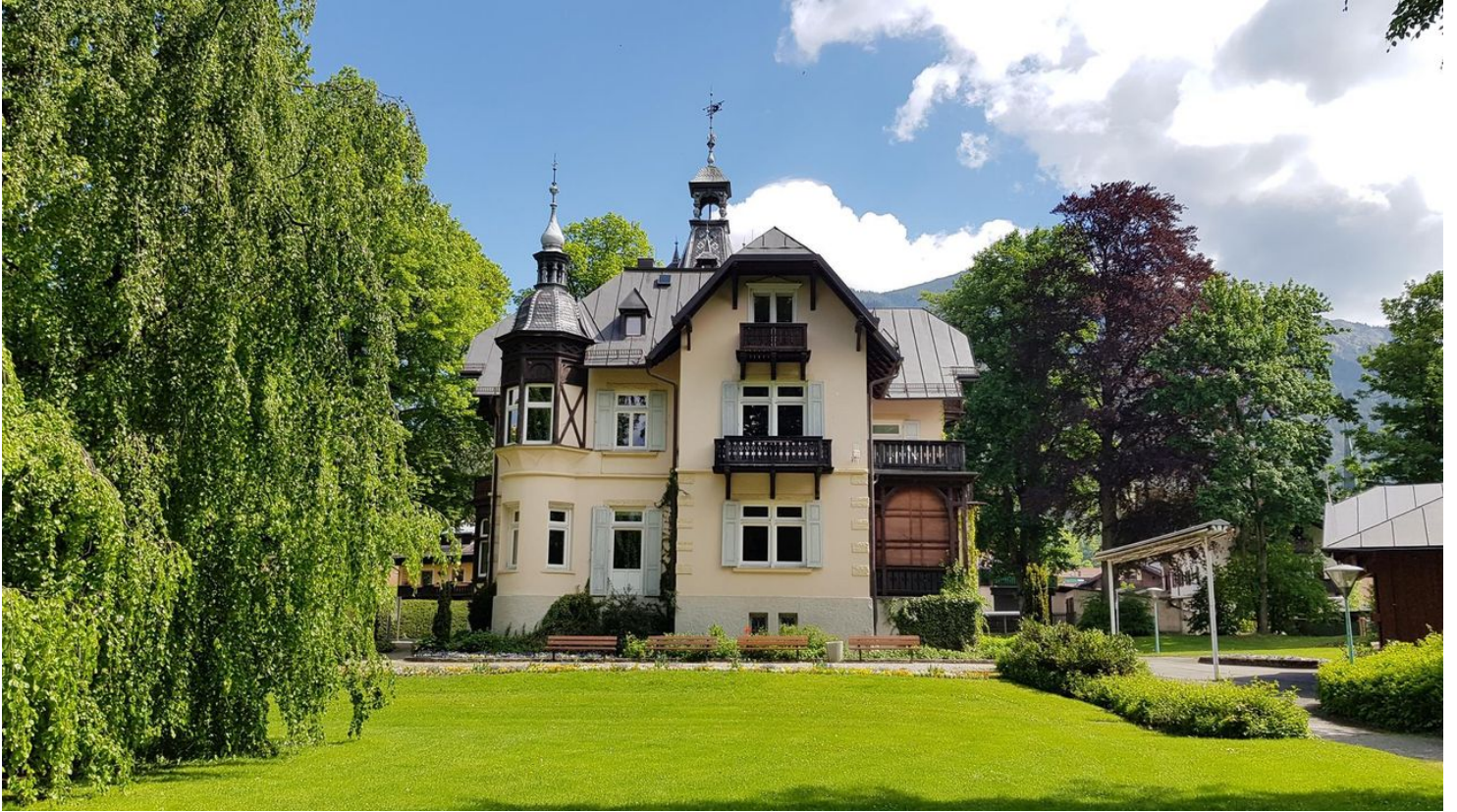
Richard-Strauss Institut