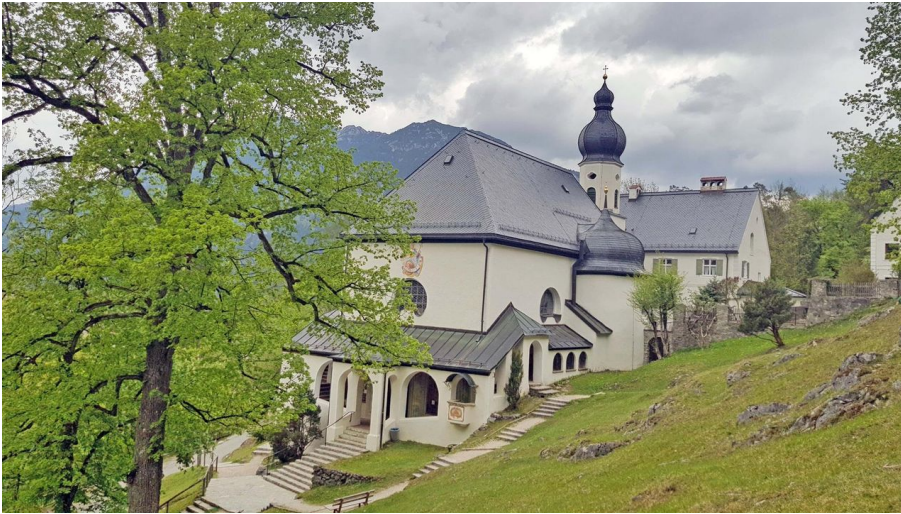
St. Anton Wallfahrtskirche