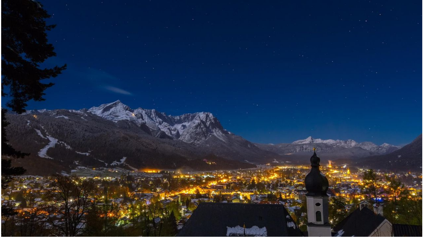
St. Anton Kirche