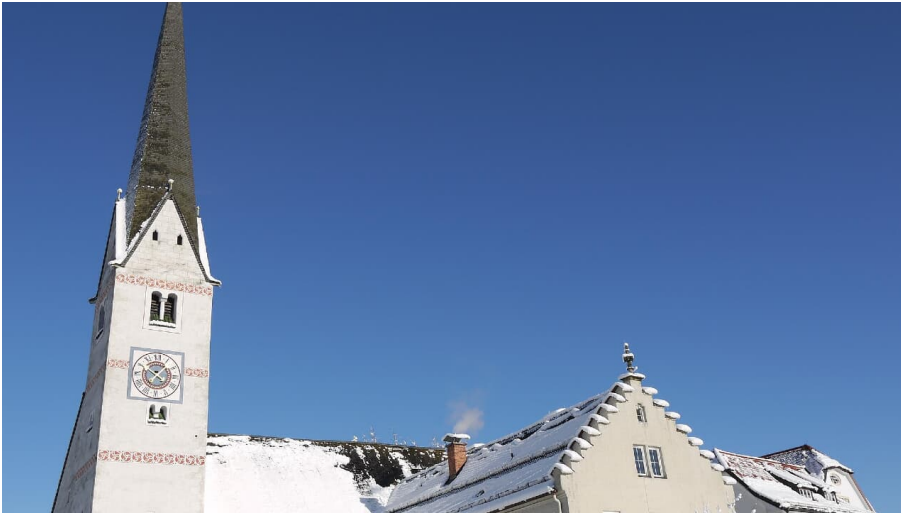
Alte Kirche Garmisch