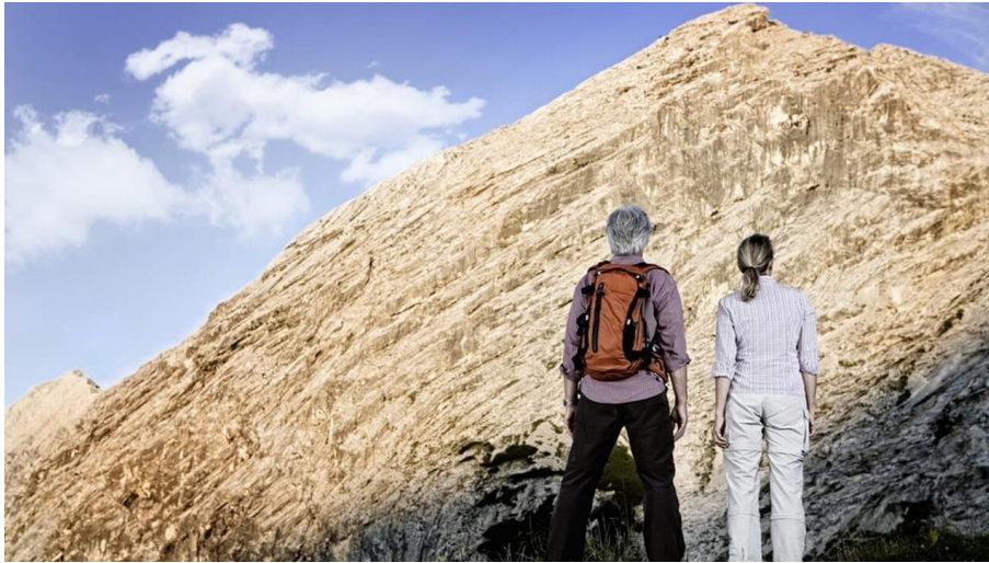
Bergführer Zugspitzland