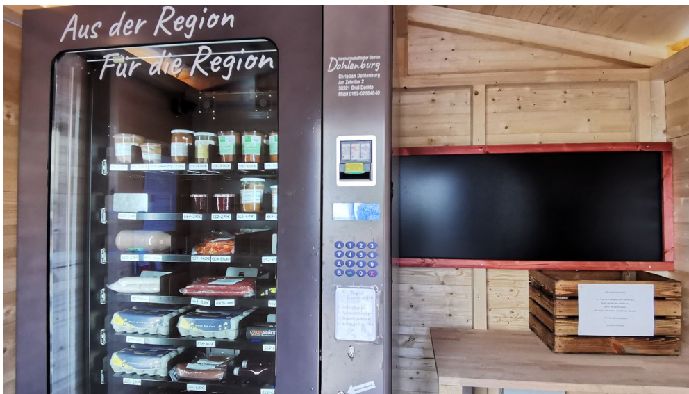
Regiomat Dohlenburg Neuer Weg 3.jpg - © Demontis