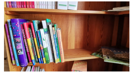
Regiomat Dohlenburg Neuer Weg 4.jpg