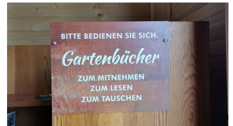
Regiomat Dohlenburg Neuer Weg 5.jpg