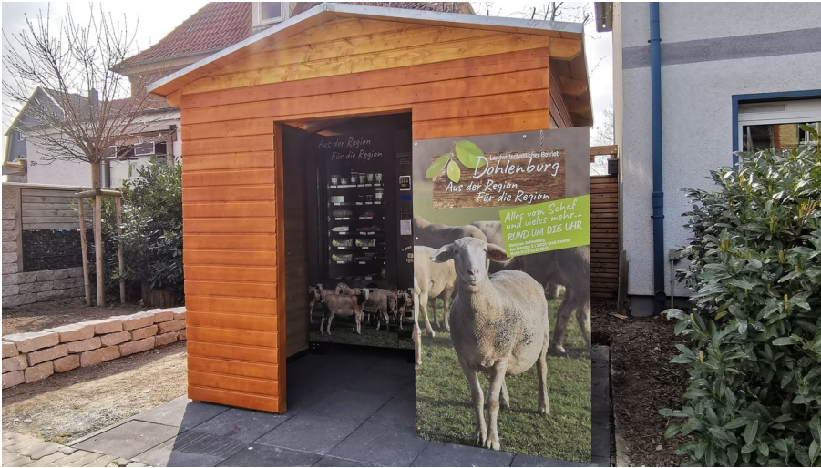
Regiomat Dohlenburg Neuer Weg 1.jpg