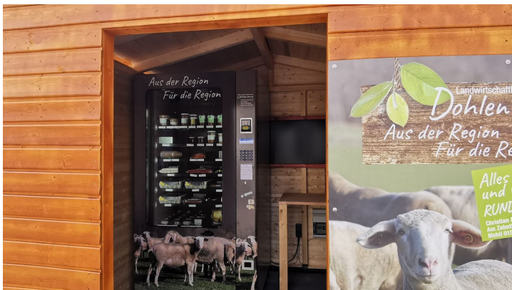
Regiomat Dohlenburg Neuer Weg 2.jpg