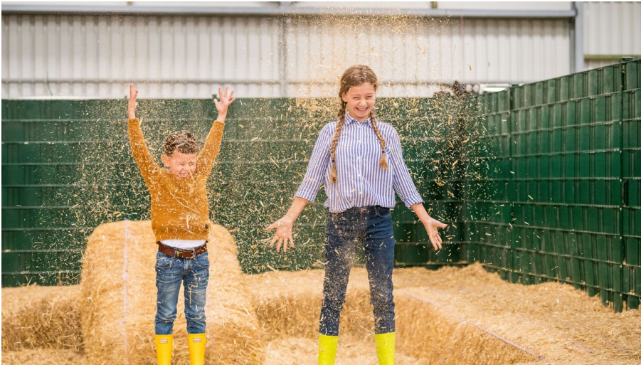
Spaß & Abenteuer auf Gut Hixholz in Velbert