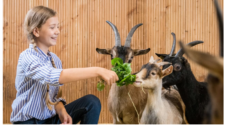
Ziegen verpflegen auf Gut Hixholz in Velbert