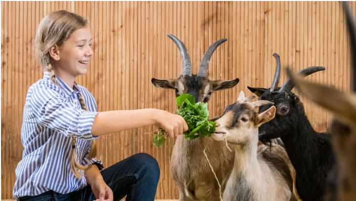
Ziegen verpflegen auf Gut Hixholz in Velbert

Die Preise erfahren Sie beim Anbieter und sind abhängig vom Angebot.