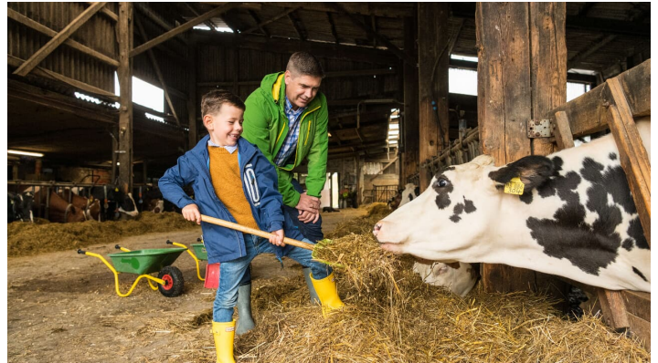
Kühe füttern auf Gut Hixholz in Velbert