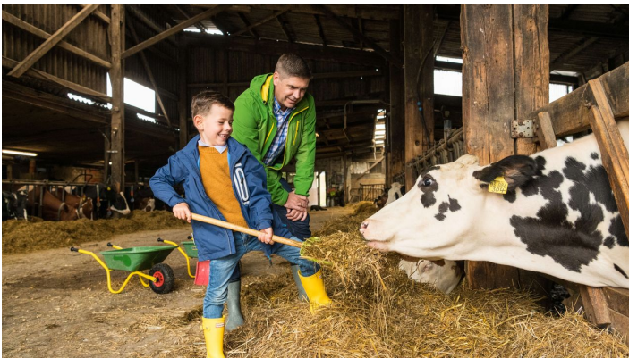
Kühe füttern auf Gut Hixholz in Velbert

Die Preise erfahren Sie beim Anbieter und sind abhängig vom Angebot.