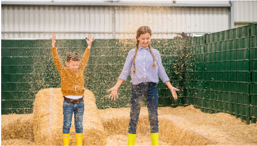
Spaß & Abenteuer auf Gut Hixholz in Velbert - © Dominik Ketz, Kreis Mettmann