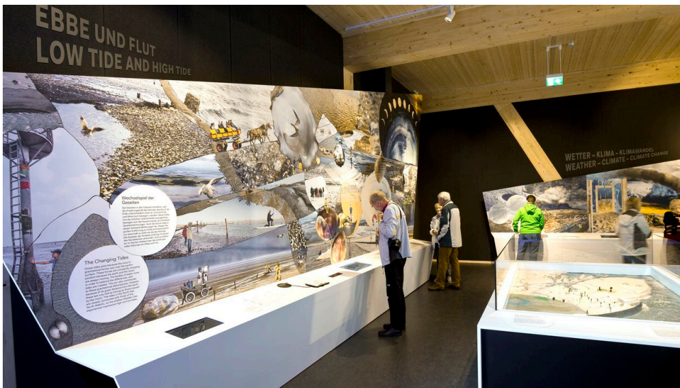
Wattenmeer-Besucherzentrum Cuxhaven