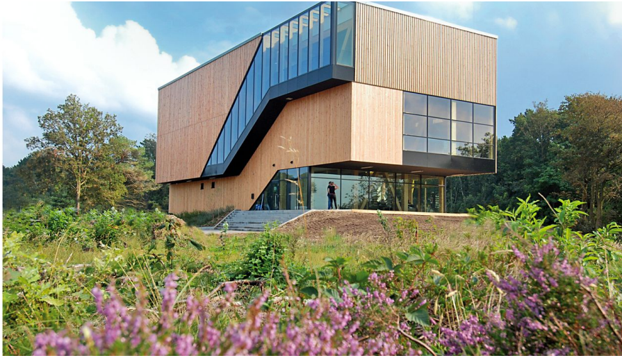
UNESCO-Weltnaturerbe Wattenmeer-Besucherzentrum Cuxhaven