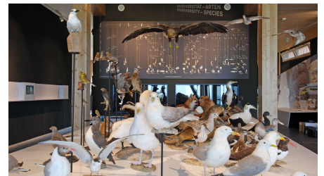
UNESCO-Weltnaturerbe Wattenmeer-Besucherzentrum Cuxhaven