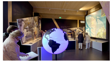
UNESCO-Weltnaturerbe Wattenmeer-Besucherzentrum Cuxhaven