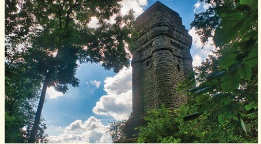
Der Bismarckturm

Der 25,5 m hohe Bismarckturm bietet einen fantastischen Blick auf Kassel und das Kasseler Becken. Bei guter Sicht sind der Brocken und der Hohe Meißner zu sehen. Der Turm ist frei zugänglich.