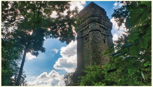
Der Bismarckturm

Naturpark-Rundweg 4 (Streckenlänge: 3,0 km) Parallel zum Dönchebach verläuft der stets leicht ansteigende Weg hinauf zum Bismarckturm. Etwa auf halber Strecke bietet sich ein Blick auf ehemalige Wirtschaftsgebäude der „Zeche Marie“, die 100 Jahre lang bis 1966 Braunkohle zutage gefördert hat. Der 25,5 m hohe Bismarckturm bietet einen fantastischen Blick auf Kassel und das Kasseler Becken. Bei guter Sicht sind der Brocken und der Hohe Meißner zu sehen. Der Turm ist frei zugänglich.