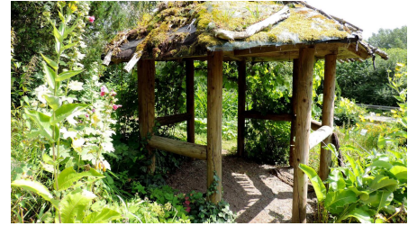
Kurpark Bad Emstal Pavillon 106