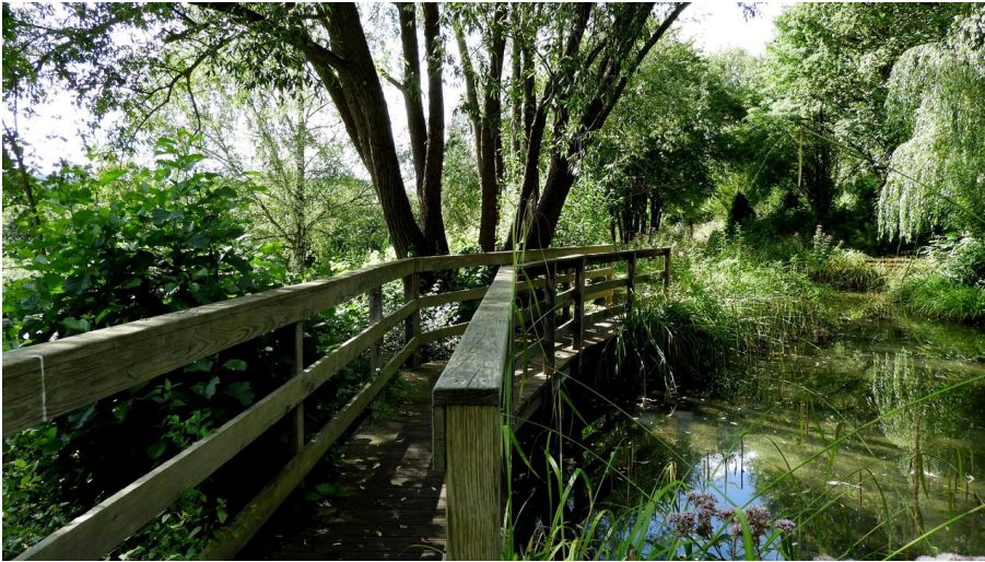
Kurpark Bad Emstal Brücke im Rosen-Garten