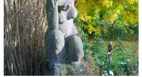
Kunst im Kurpark Bad Emstal