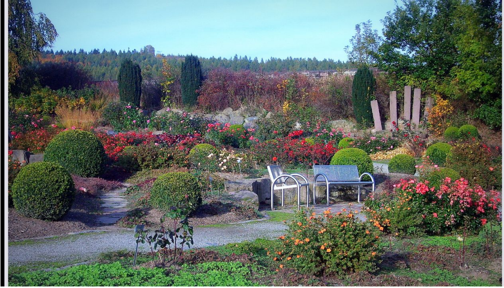
Rosengarten im Kurpark Bad Emstal