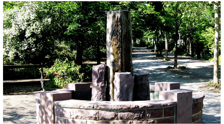
Kurpark Bad Emstal