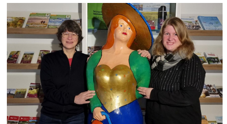
Mitarbeiterinnen in der TI Naumburg