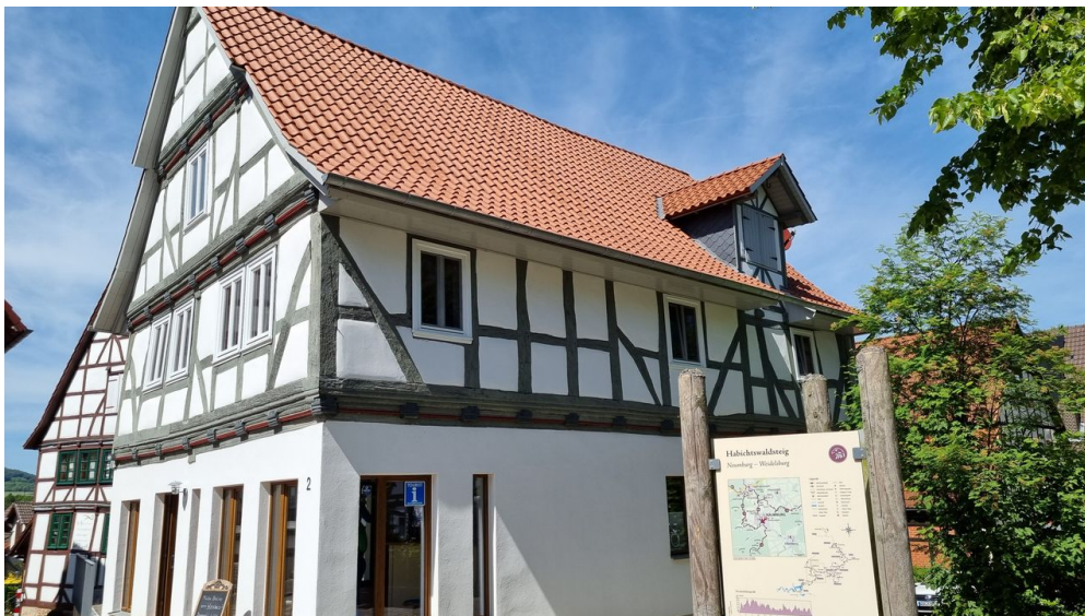
Naumburg Touristinformation - © TAG Naturpark Habichtswald e.V., Claudia Thöne

Rosenmontag Geschlossen: 20.02.2023 Karfreitag Geschlossen: 07.04.2023 Ostermontag Geschlossen: 10.04.2023 Christi Himmelfahrt Geschlossen: 18.05.2023 Fronleichnam Geschlossen: 08.06.2023 geschlossen Geschlossen: 22.09.2023 Geschlossen: 21.12.2023 Tag der Arbeit Geschlossen: 01.05.2024 Tag der Wiedervereinigung Geschlossen: 03.10.2024 1. Weihnachtstag Geschlossen: 25.12.2024 2. Weihnachtstag Geschlossen: 26.12.2024 Sylvester Geschlossen: 31.12.2024 Neujahr Geschlossen: 01.01.2025