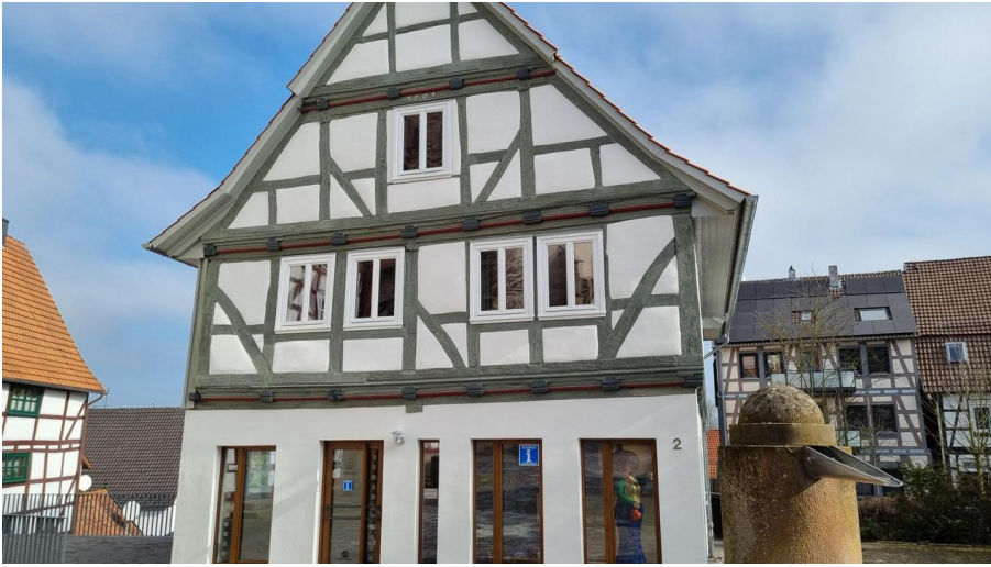
Touristinformation Naumburg Hessen