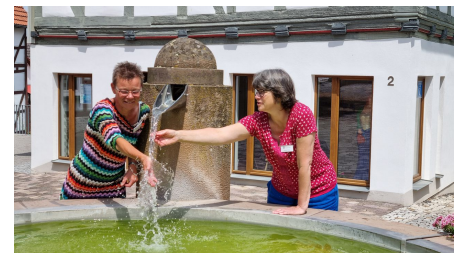
Mitarbeiterinnen in der TI Naumburg