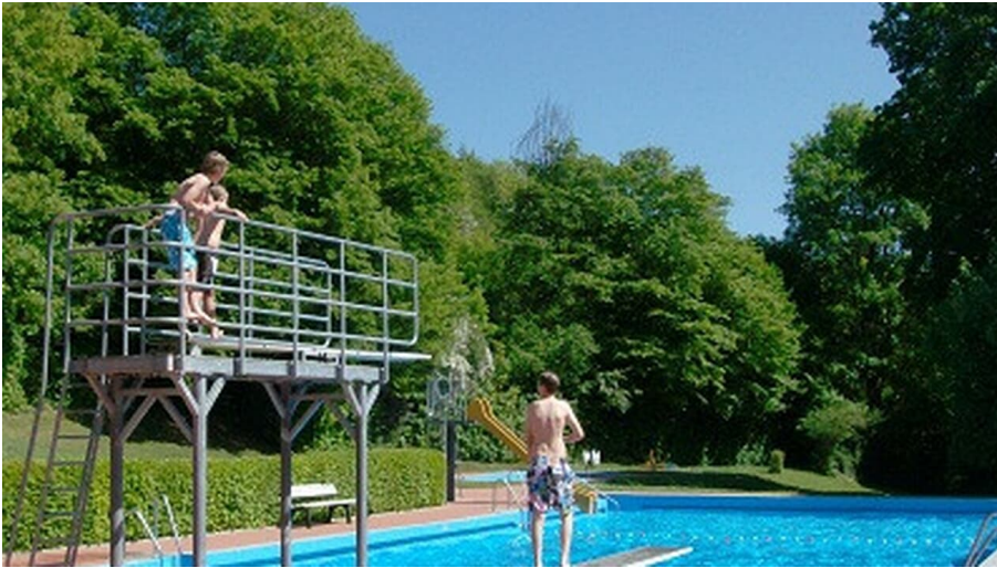
Naumburg Freibad Heimarshausen