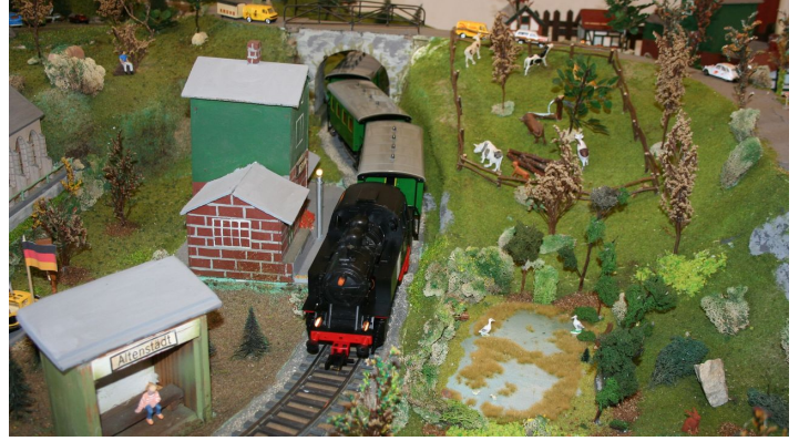
Eisenbahnmuseum Naumburg