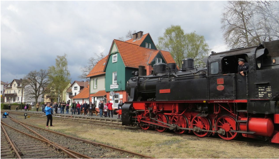
Hessencourrier Bahnhof Naumburg