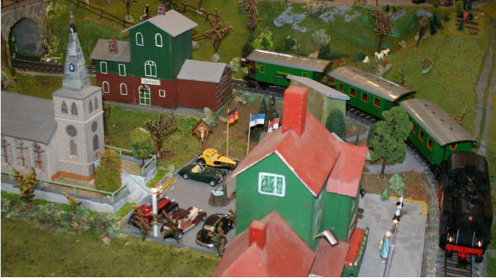
Eisenbahnmuseum Naumburg