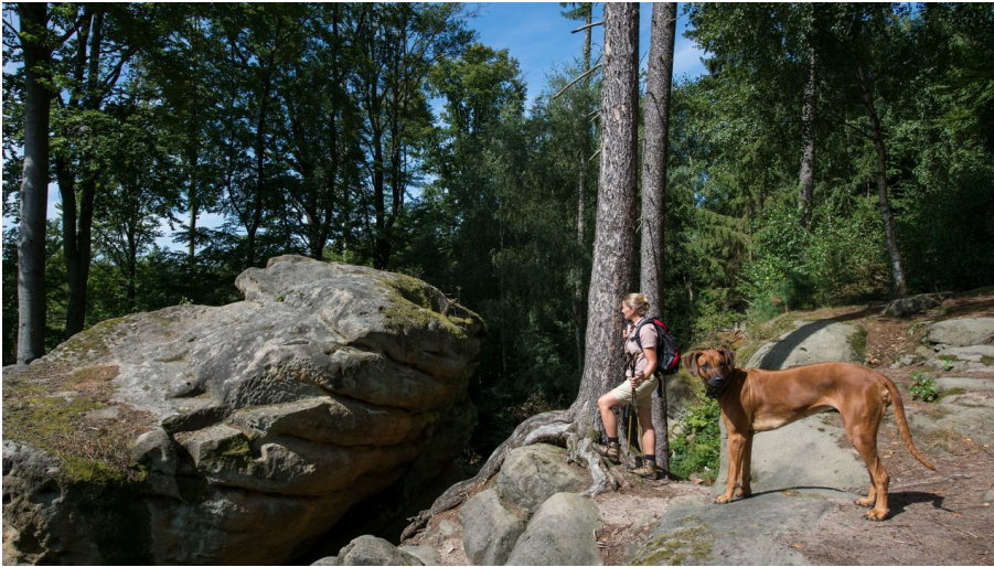
Riesenstein bei Naumburg Heimarshausen