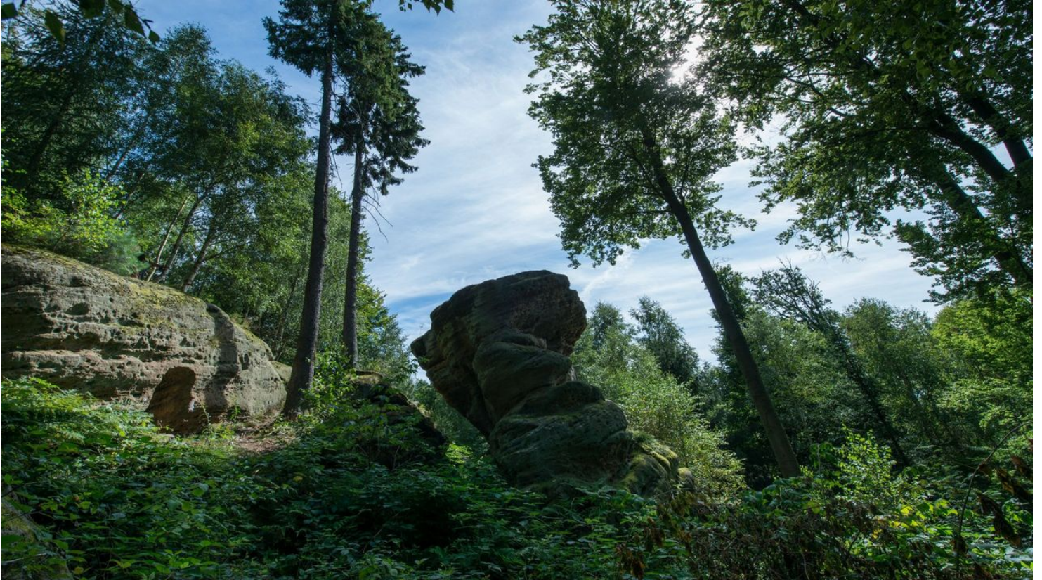
Naumburg Heimarshausen Riesenstein