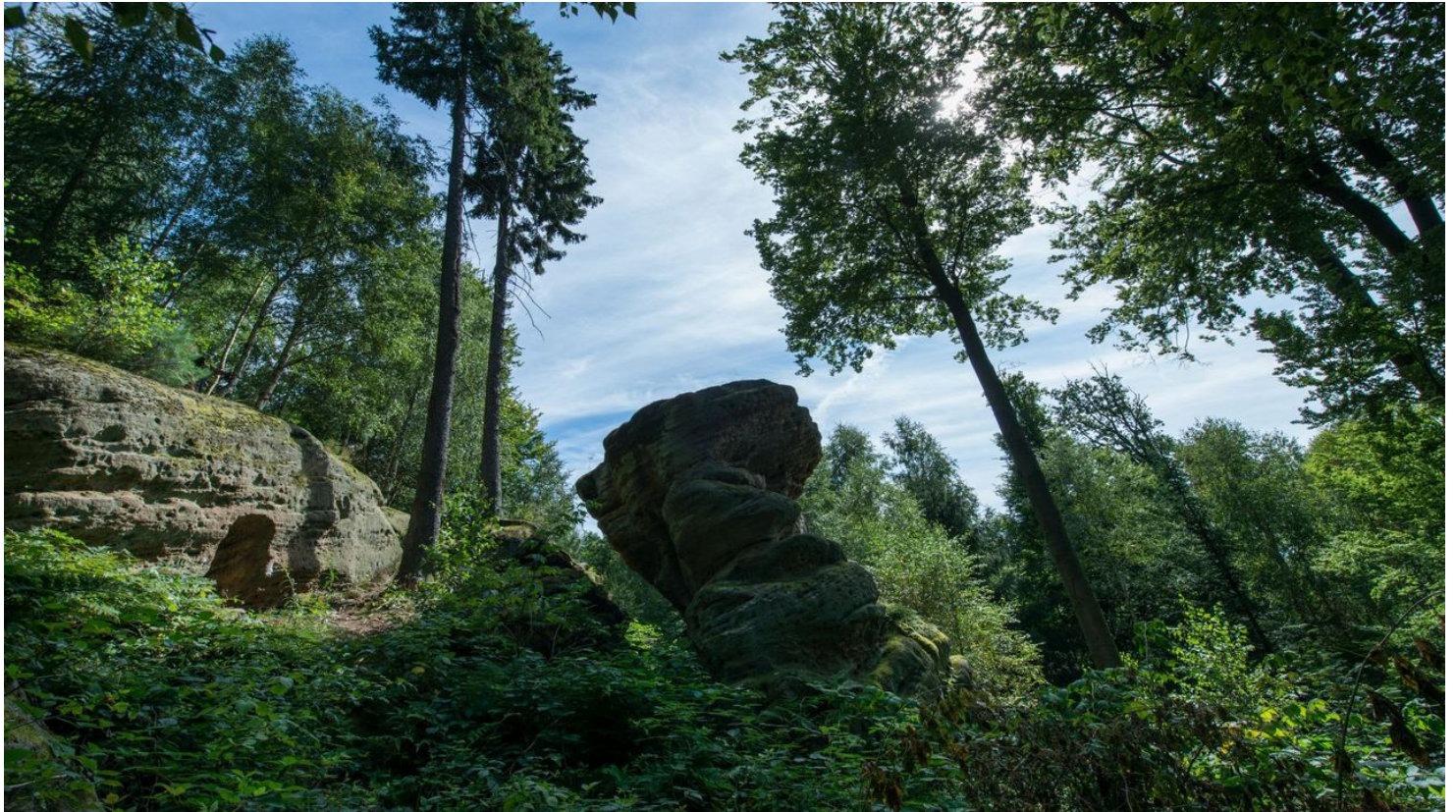
Naumburg Heimarshausen Riesenstein