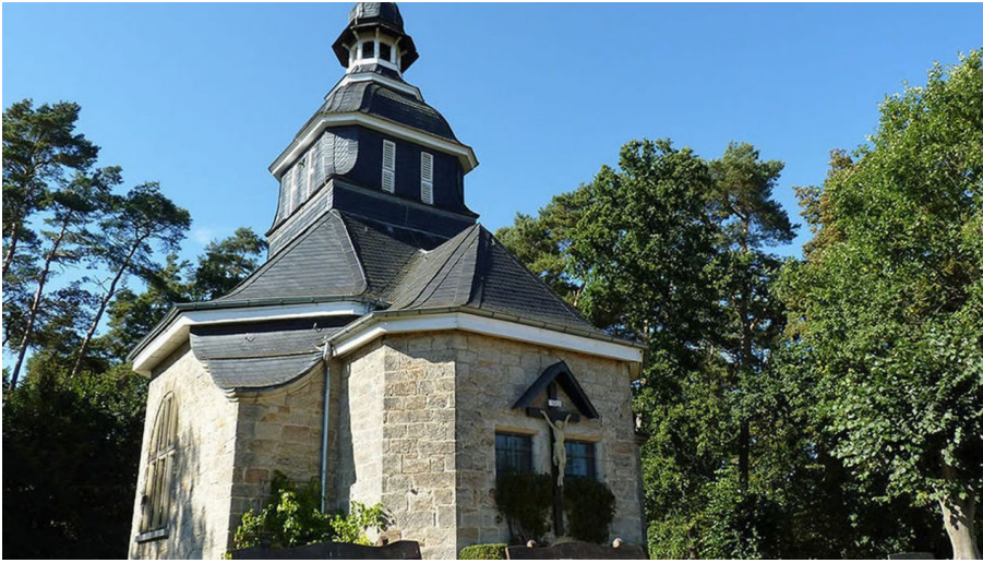
Weingartenkapelle Naumburg