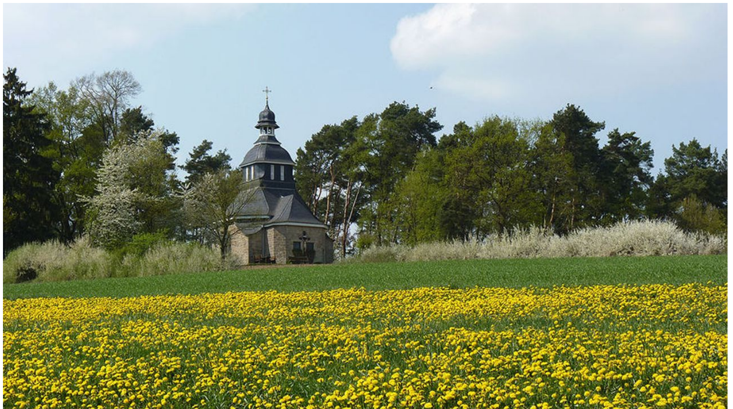
Weingartenkapelle Naumburg