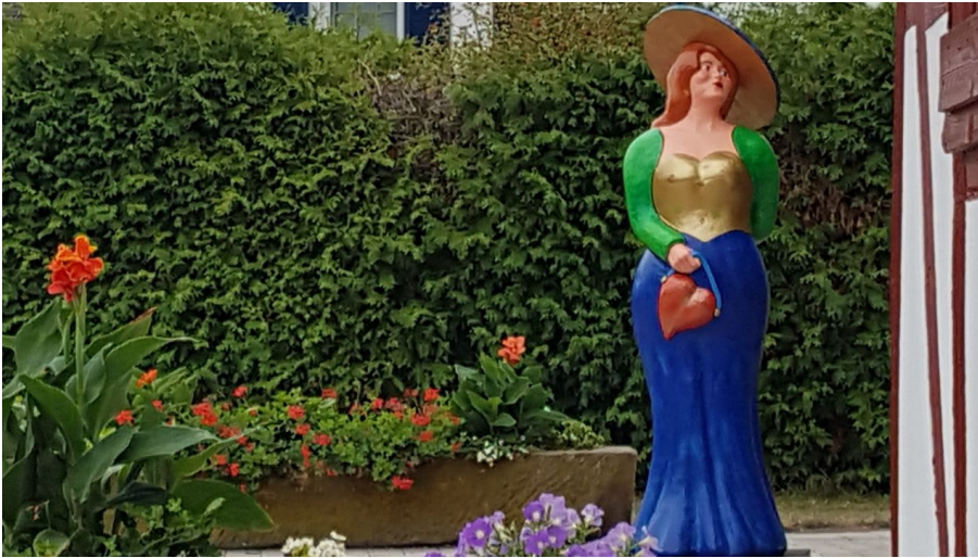
Kneipp-Kurgarten mit Bella