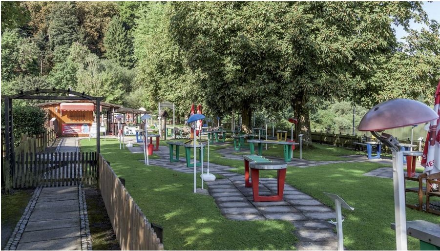
Minigolf - © Stadt Bad Karlshafen