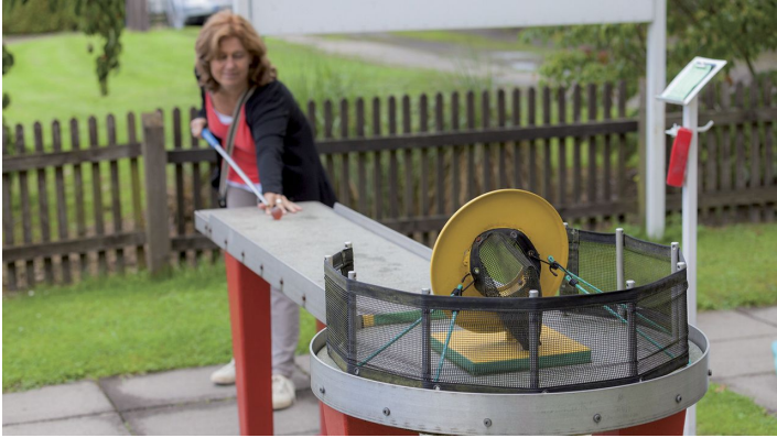
Pit Pat