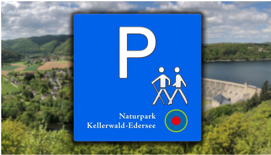
Wanderparkplatz Naturpark Kellerwald-Edersee - © Karuna Eckel, Edersee | Deine Region: wild, bunt, gesund.