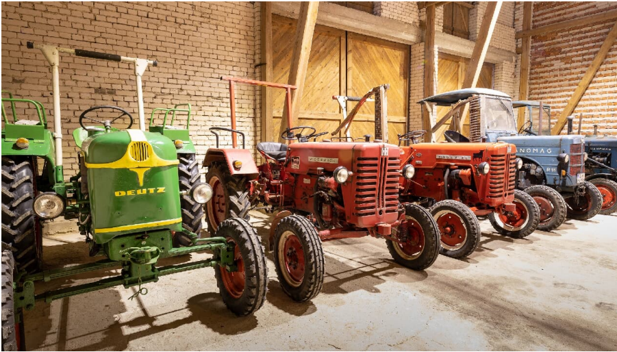
Steimker Selbstzünder - Oldtimer-Traktoren