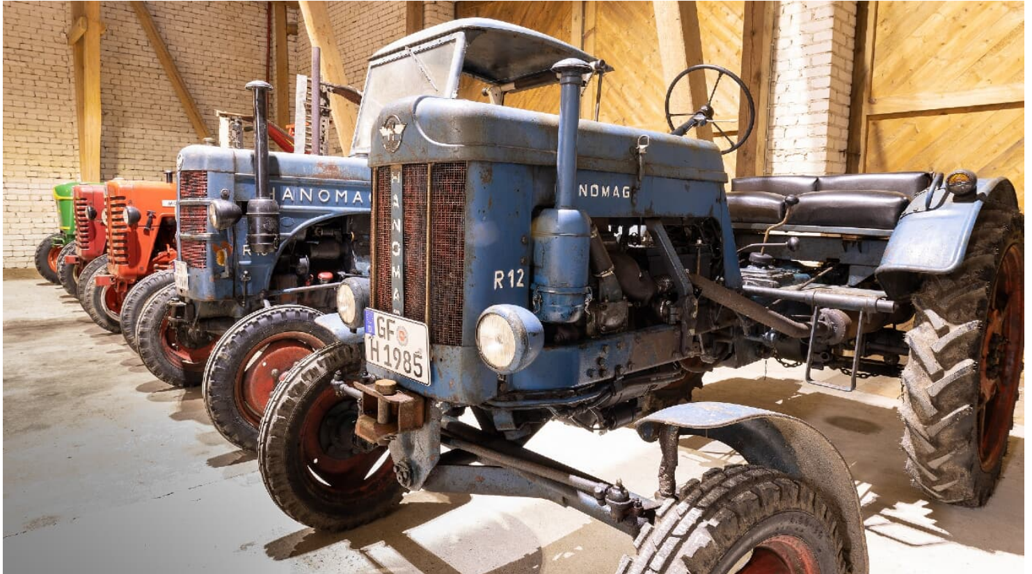
Steimker Selbstzünder - Oldtimer-Traktoren

120 Euro pro Tag und Traktor (Kraftstoff inbegriffen). Außerdem wird eine Kautions von 300 Euro pro Schlepper vor Reisebeginn hinterlegt und nach Reiseende wieder zurückgezahlt.