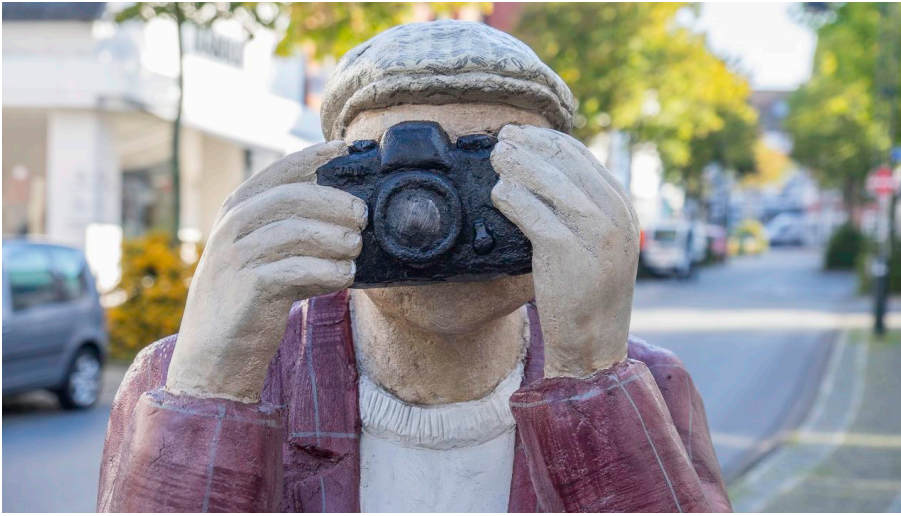
Alltagmenschen in Wiedenbrück