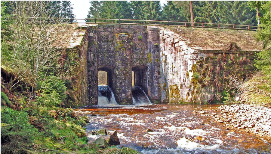
Forbach - Herrenwieser Schwallung