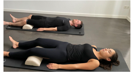
Ganzheitliche Physiotherapie