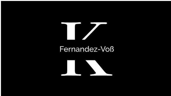
Logo - © Konstanze Fernandez-Voß