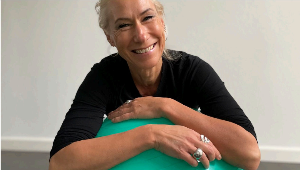
Konstanze Fernandez-Voß