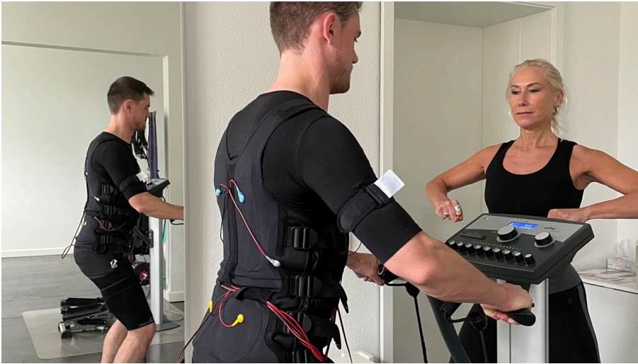
EMS Maximale Erfolge in nur 20 Minuten pro Woche