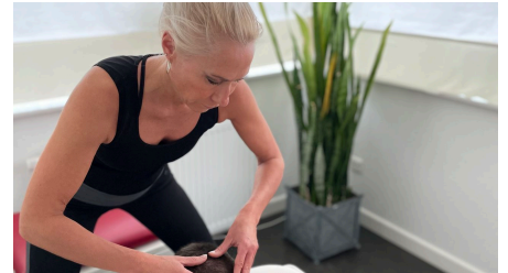
Ganzheitliche Physiotherapie