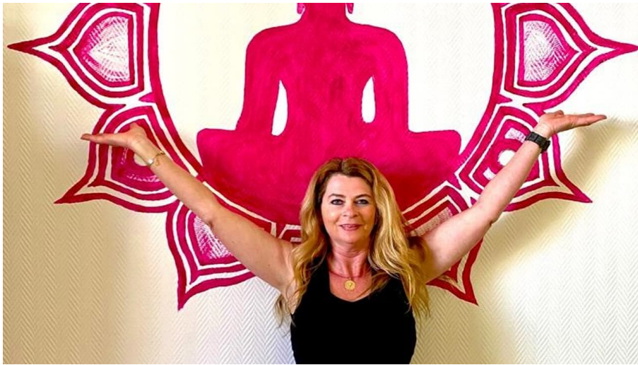
Heidi Lödige Yoga - © Heidi Lödige