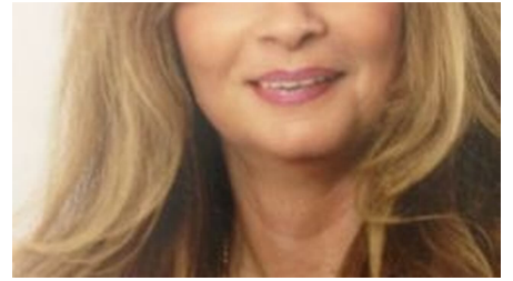
Heidi Lödige - © Heidi Lödige