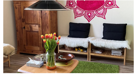
Eingangsbereich - © Heidi Lödige