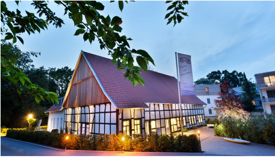
Nachtaufnahme mit Baum