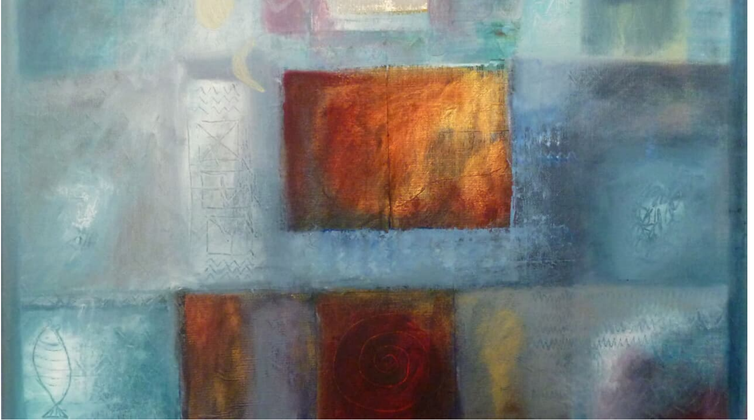
Gina Feder - Fische in Komposition Blau (2).jpg