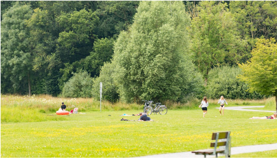
Naherholungsgebiet Große Aue