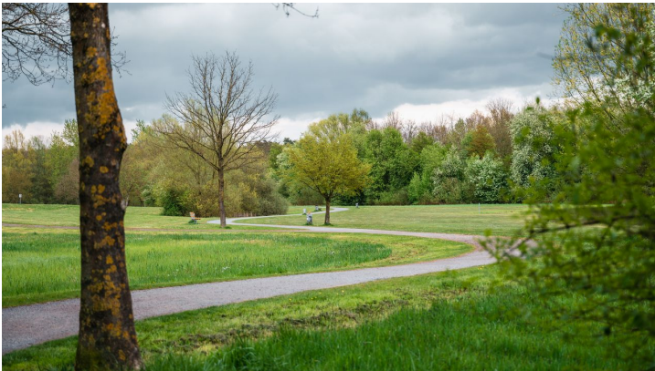
Fotowalk Tourismusverband Sieben (38 von 132).jpg