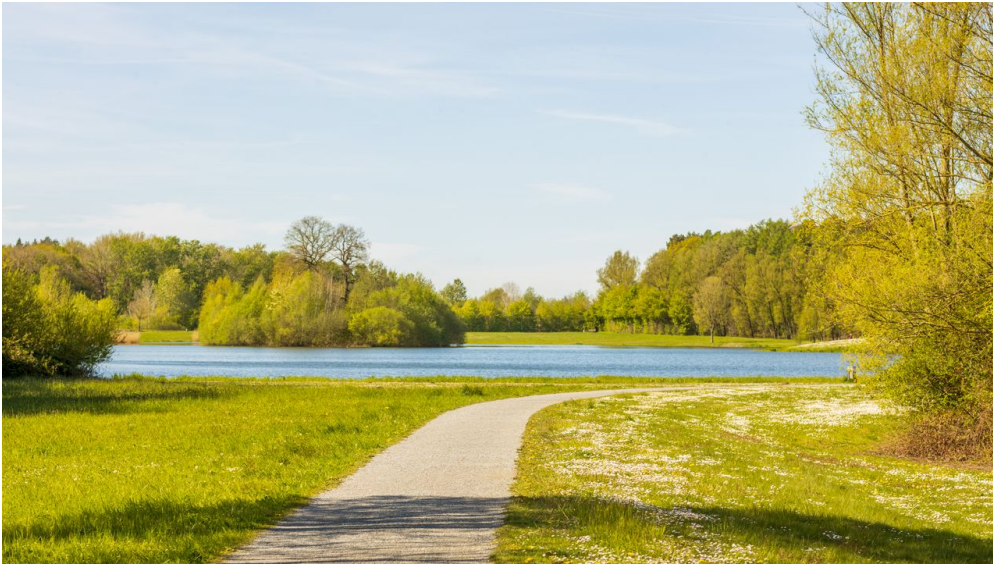
Naherholungsgebiet Große Aue