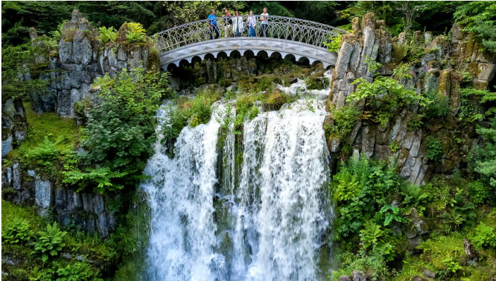
Wasserspiele Bergpark Wilhelmshöhe Teufelsbrücke

Aufgrund der begrenzten Parkplatzsituation ( https://visit.kassel.de/de/kassel/wlan/detail/POI/p_100164677/x ) und für eine entspannte An# und Abreise, empfiehlt es sich, das eigene Fahrzeug stehen zu lassen und mit dem ÖPNV ( https://visit.kassel.de/de/kassel/wlan/detail/Article/a_19182/faq-anreise-wasserspiele ) anzureisen.