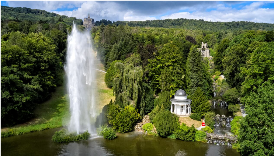
Wasserspiele Bergpark Wilhelmshöhe