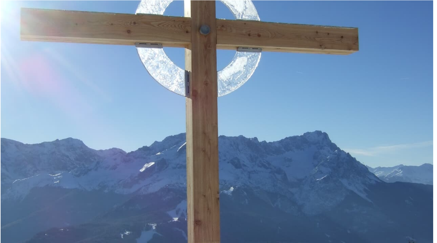
Tanja Nicklaus - Wankkreuz.jpg

ID: p_100156177 Zuletzt geändert am 11.07.2023, 08:20