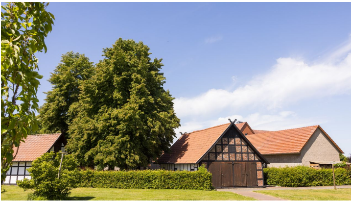
Alte Scheune & historische Schmiede Holzhausen II.