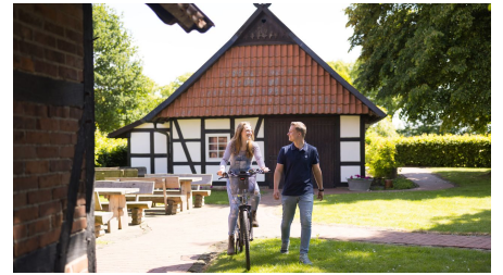
Alte Scheune & historische Schmiede Holzhausen II.