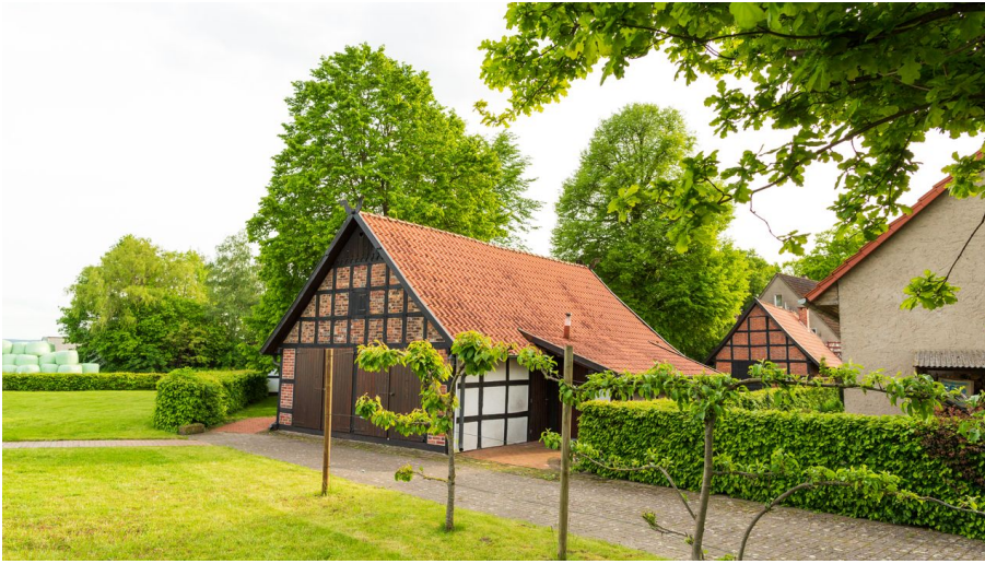
Alte Scheune