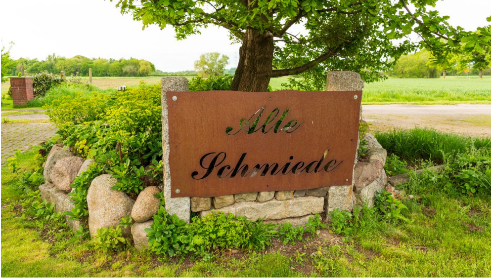
Holzhausen II