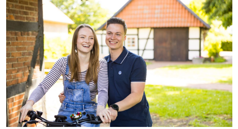
Alte Scheune & historische Schmiede Holzhausen II. - © Foto 2023 von www.ChristianSchwier.de, Christian Schwier