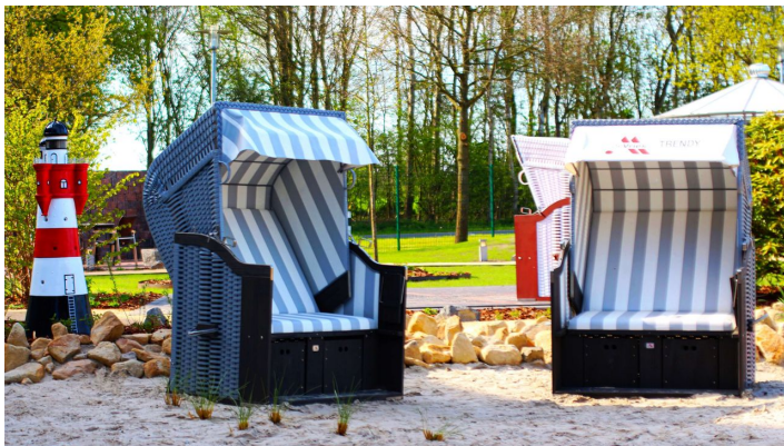
Ausstellung der Strandkörbe