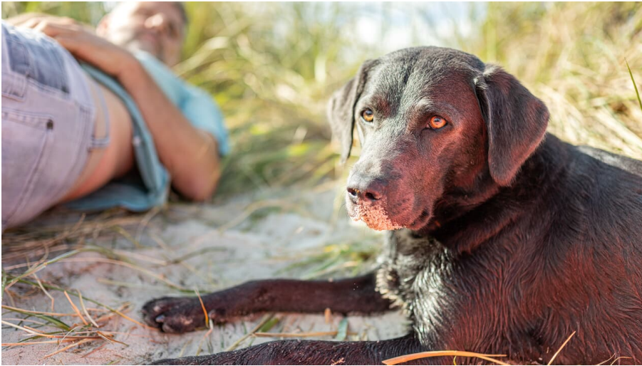
Hund-Wangerland-Oliver Franke.jpg