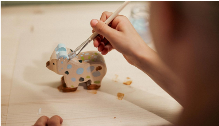
Trauffer Erlebniswelt - eine Holzfigur wird angemalt