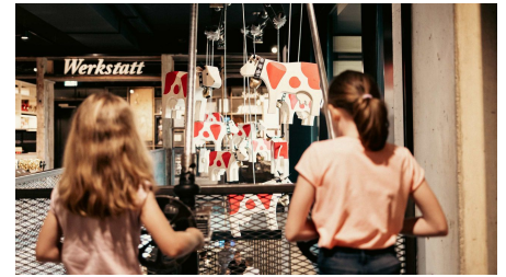
Trauffer Erlebniswelt - Holzkuh Mobile