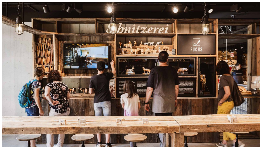
Trauffer Erlebniswelt, Ausstellung diverser Holzskulpturen