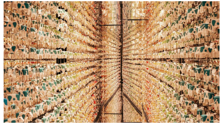
trauffer-erlebniswelt-holzkuh-spiegelgang.jpg