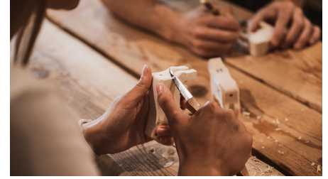
Trauffer Erlebniswelt - Holzkuh selber schnitzen