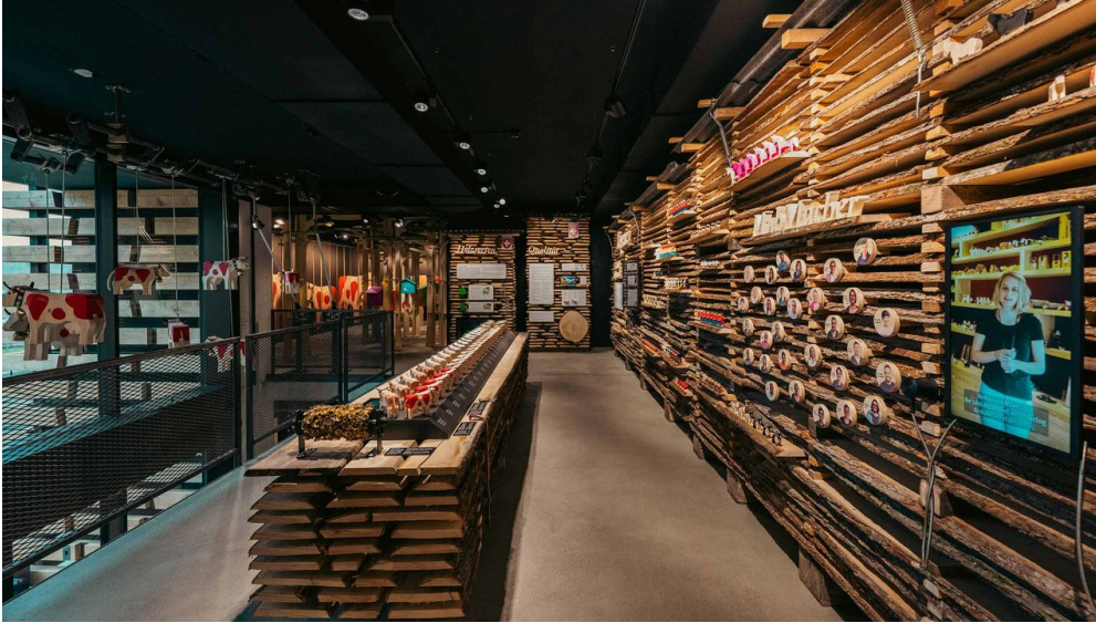
Trauffer Erlebniswelt - Rundgang mit Infos zur Entstehung der Holz-Spielwaren