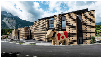
Trauffer Erlebniswelt