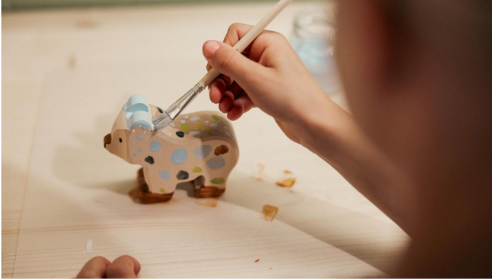
Trauffer Erlebniswelt