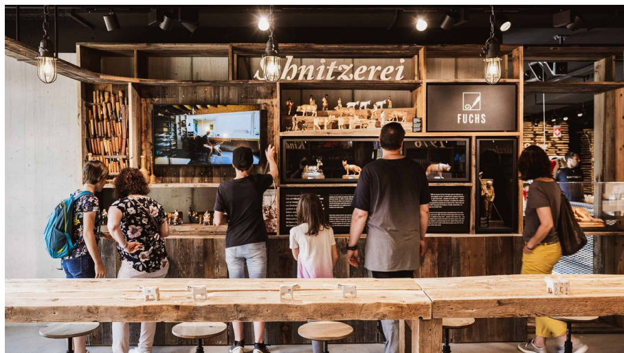
Trauffer Erlebniswelt