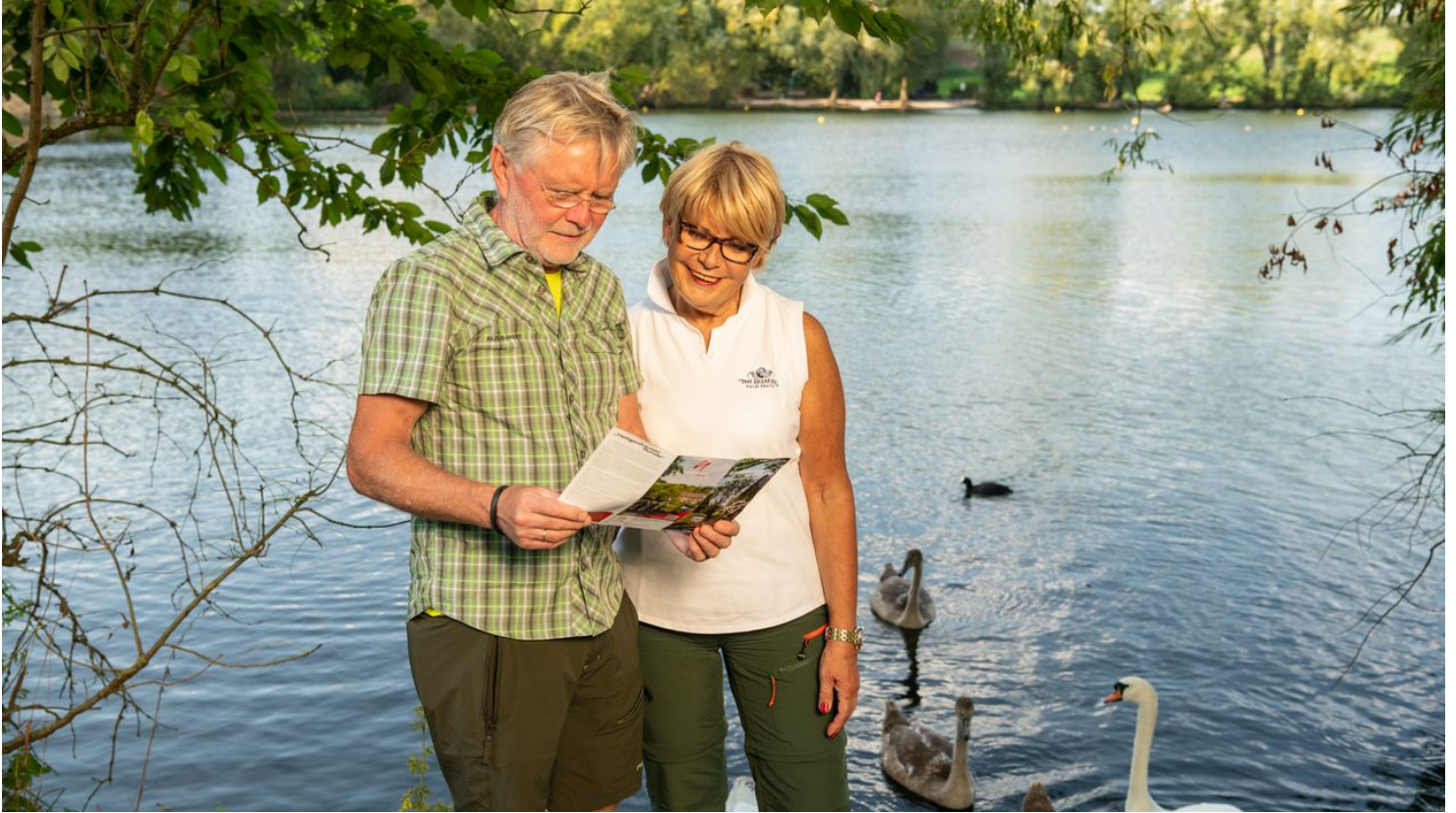
Entlang des Abtskücher Teiches in Heiligenhaus