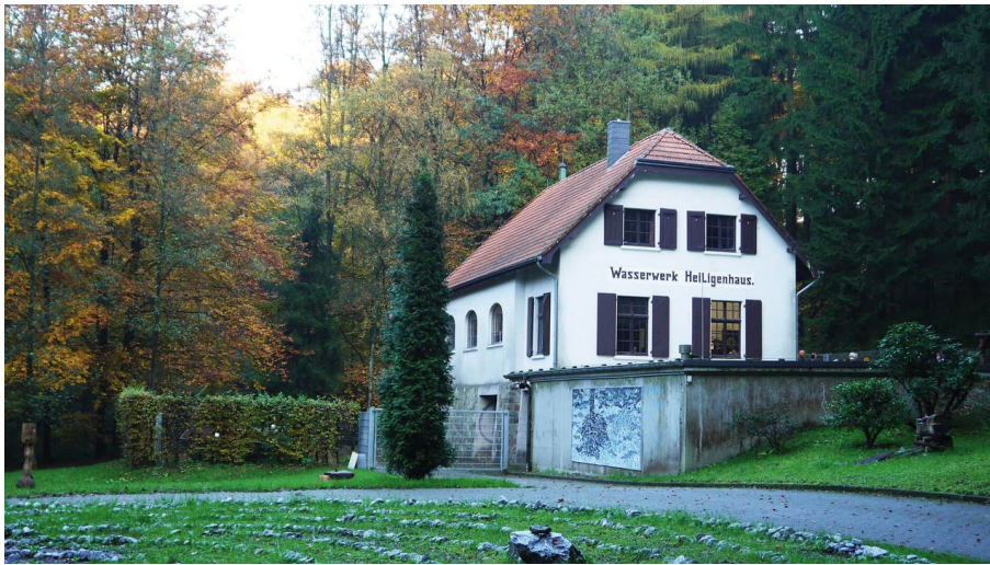
Wald- und Wassermuseum - UBZ Heiligenhaus