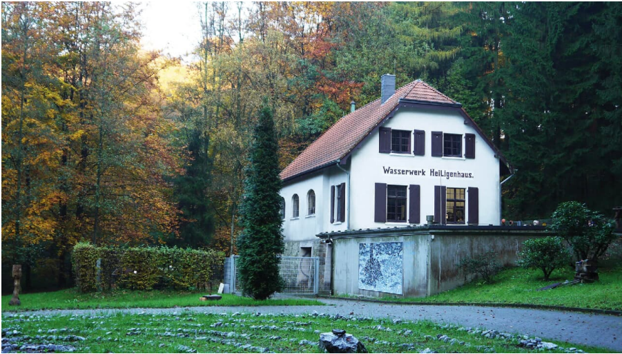
Wald- und Wassermuseum - UBZ Heiligenhaus - © Ralf Jeratsch, Stadt Heiligenhaus