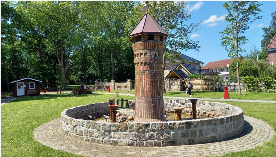
Mehrgenerationenplatz "Lüttje Festung" in Apen