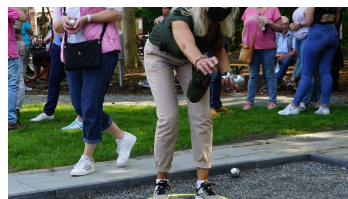
Boulespiel auf dem Mehrgenerationenplatz