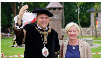
Bürgermeister und Landrätin bei der Eröffnungsfeier