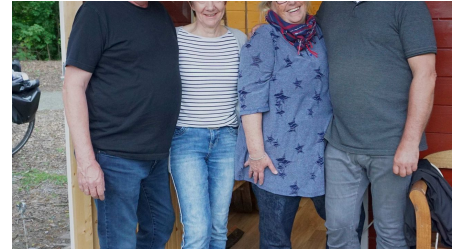
Orga-Team Grillabend Lüttje Festung