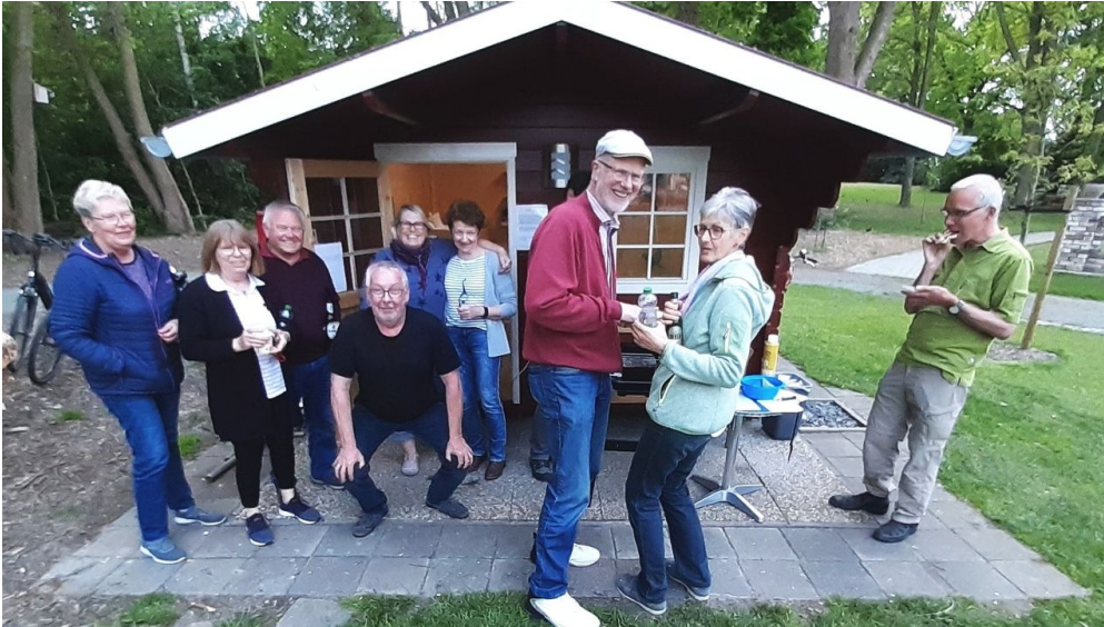
Grillabend Lüttje Festung