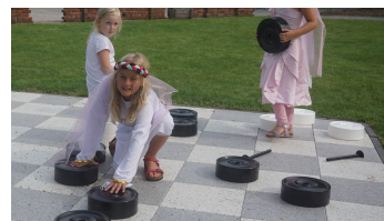
Kinder beim Mühlespiel