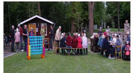
Spiel, Spaß und Geselligkeit auf dem Mehrgenerationenplatz