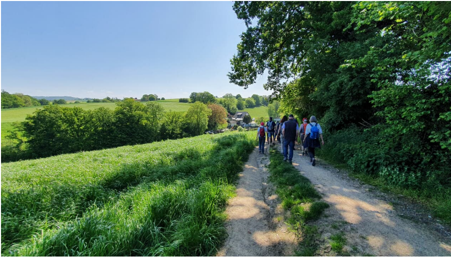
Geführte Wanderungen mit dem Weggefährten