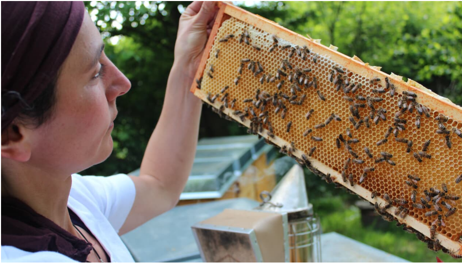
Bienenwabe der Bioland Gärtnerei Nermins Garten, Mettmann