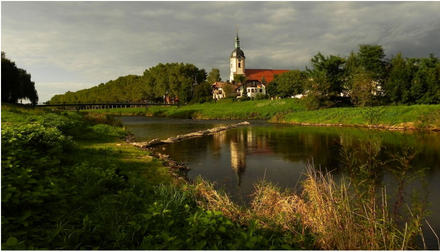
01 Mutterkirche des Murgtals St. Laurentius