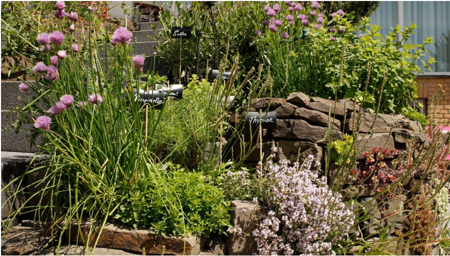
Schaugarten bei der Haaner GartenLust in Haan