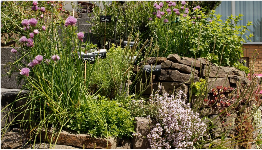
Schaugarten bei der Haaner GartenLust in Haan