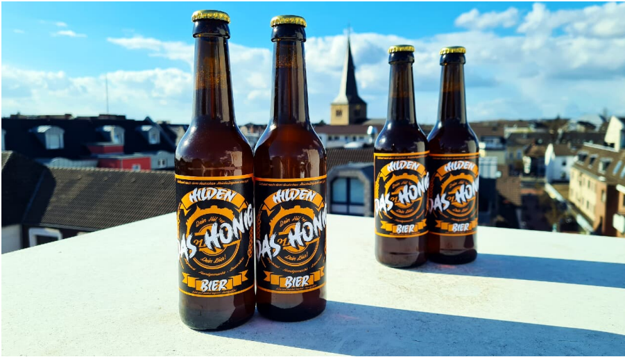
Biermanufaktur Hilden