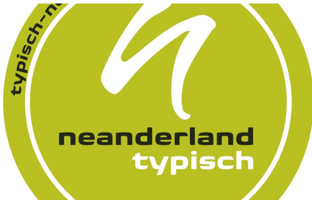
TYPISCH neanderland Siegel