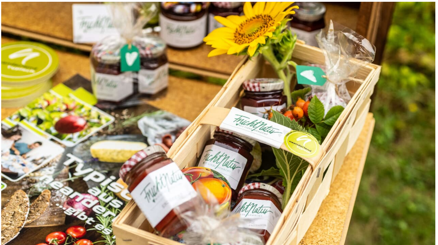
Fruchtnatur Aufstriche aus Langenfeld