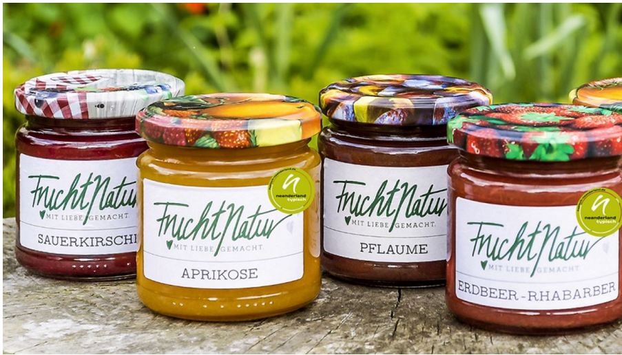
FruchtNatur aus Langenfeld