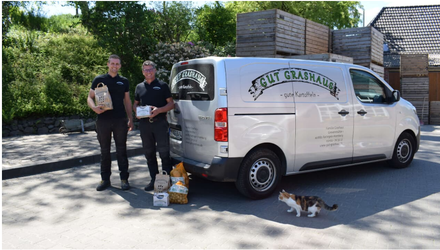
Gut Grashaus aus Ratingen