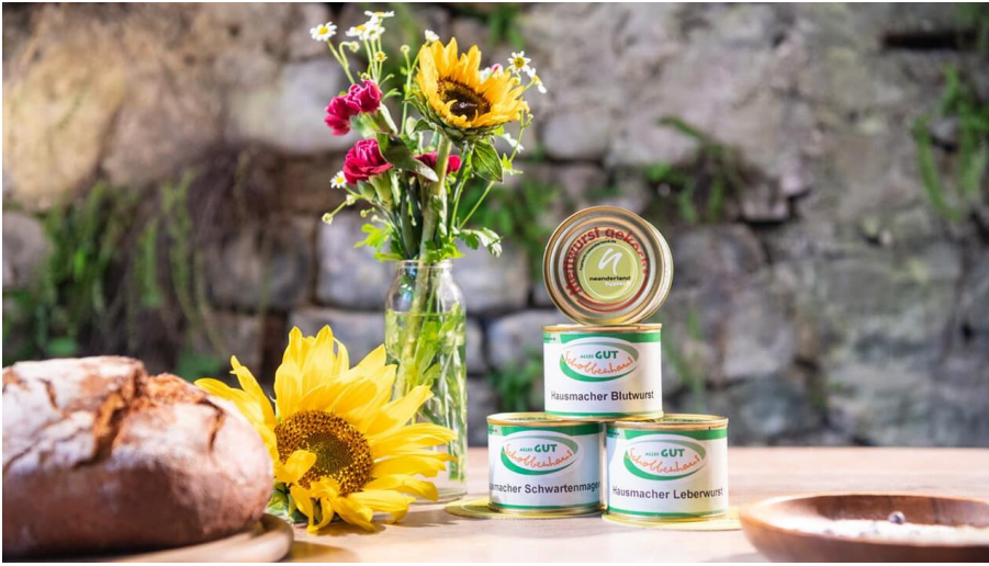
Gut Schobbenhaus aus Mettmann