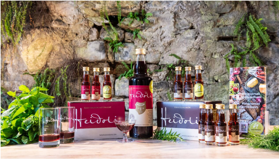
Heidoli - Getränke Doppstadt GmbH